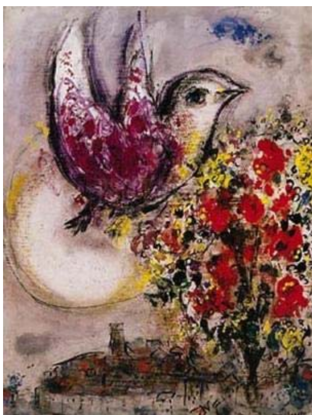
un volo leggero richiama il senso di ciò che già c'è ma forse di più di ciò che c'è nell'attesa

L'azione contemplativa pertanto ci permette di entrare in relazione con l'altro, con le cose attraverso una sapiente indifferenza che ci consente di gustare la vita senza privazioni ma soprattutto senza ingordigia ed avidità.